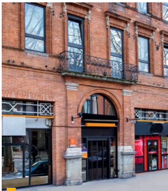
8, boulevard de Strasbourg à Toulouse (31)