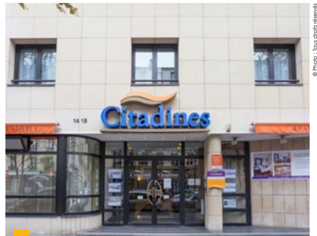
14-18, rue de Chaligny à Paris 12 ème

* Montant total des loyers facturés rapporté au montant total des loyers facturables, c'est-à-dire loyers quittancés + loyers potentiels des locaux vacants.